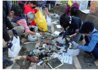
善福寺川感謝祭～川ごみ拾い