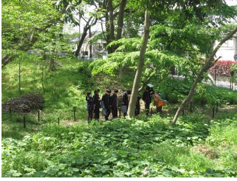
三井の森公園で自然観察

区内小中学校、高等学校、児童館などへの環境学習支援に力を入れています。年々、ニーズが増え、そのため環境学習サポーターのスキルアップなども日頃から心がけています。児童や生徒に寄り添った学習が進められるようなサポートを行っています。