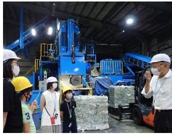
資源のリサイクル施設見学会