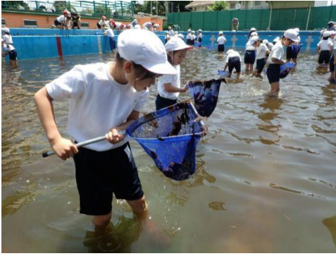
プールでヤゴ救出