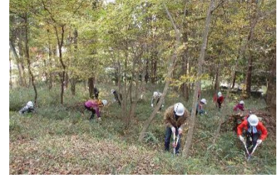
勝沼城跡での作業～下草刈り

「みどりに親しみ、知り、育てる」を目的に、2020年東京オリンピック総合馬術競技会場の東京港「海の森公園」での森の育成や、青梅市の勝沼城跡歴史環境保全地域での下草刈り、間伐、里山の貴重植物の保護などに取り組んでいます。