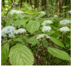
コアシサイ(勝沼城跡)