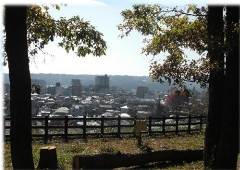
展望台からの景色