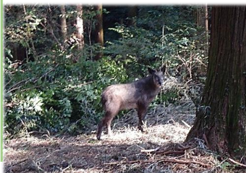
森で見かけたカモシカ