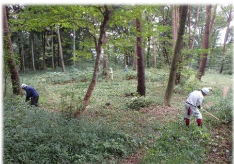
作業風景(本丸跡地の下草刈り)