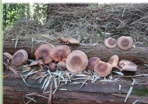
ホダギ(伐採した木)からシイタケ